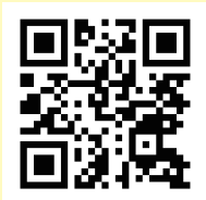
ご相談はこちらから