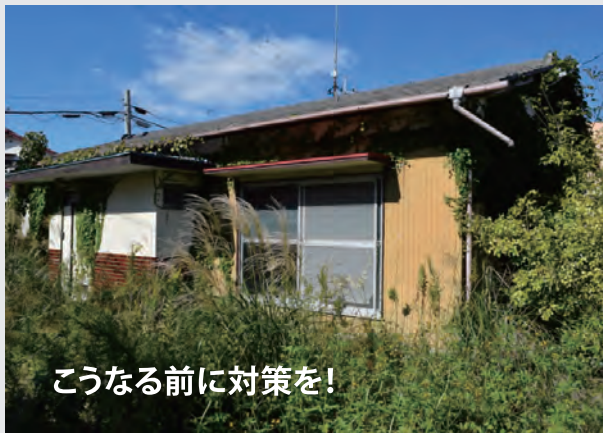
こうなる前に対策を！