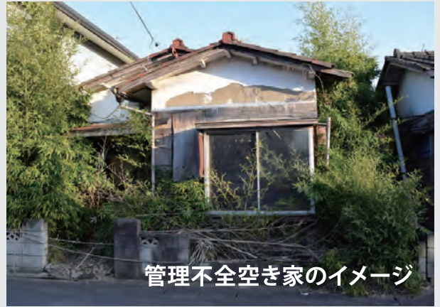
管理不全空き家のイメージ

空き家の窓ガラスの一部が割れたまま、敷地内にゴミ等が散乱している状態のまま放置すると「管理不全空き家」に指定される恐れがあります。